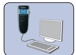
... USB-Audio zum Diktieren am PC